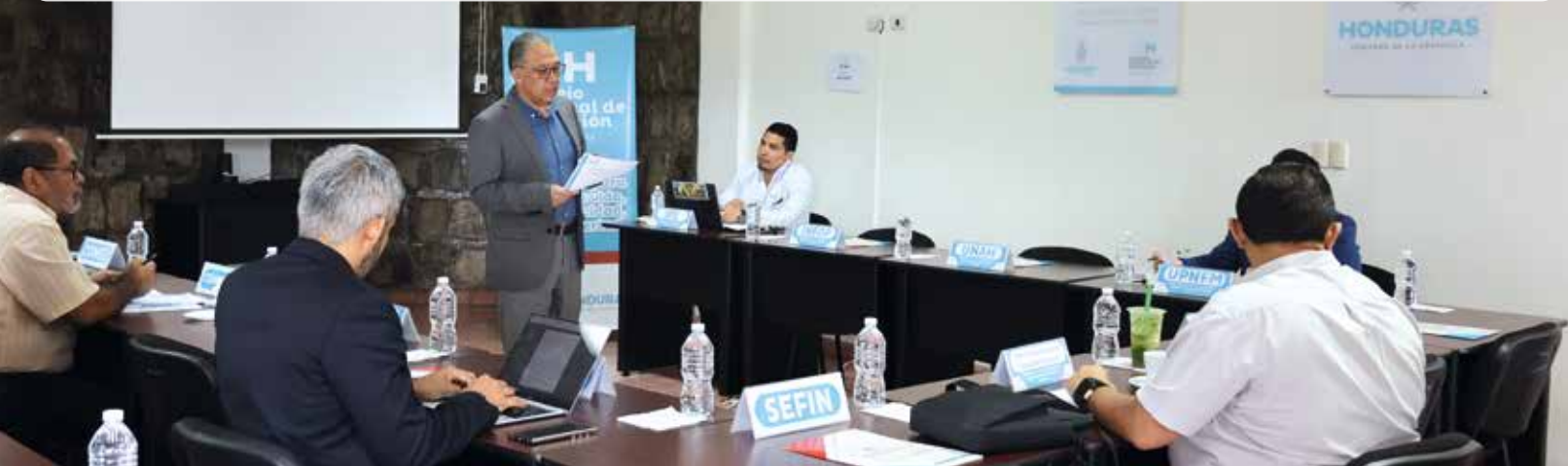
JORNADA TÉCNICA EN TRANSFERENCIA DE TECNOLOGÍAS PARA EL SECTOR GANADERO

Se llevó a cabo el Segundo Encuentro de Instituciones que integran el CONED e invitadas, en el que se presentó un reporte de avances del Primer Encuentro, los avances del Sistema Integrado de Información Educativa (SIIE/CONEANFO), un informe sobre el estado y avances de la Política de Educación y Formación Técnica Profesional de Honduras.